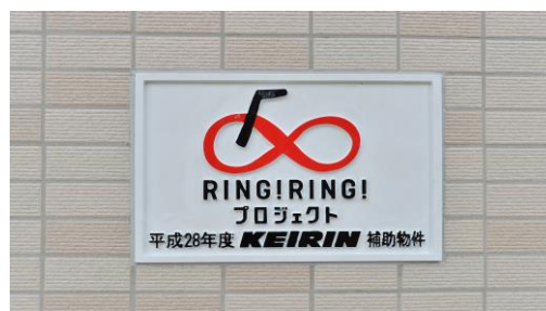
正面玄関の標識表示がわかる写真